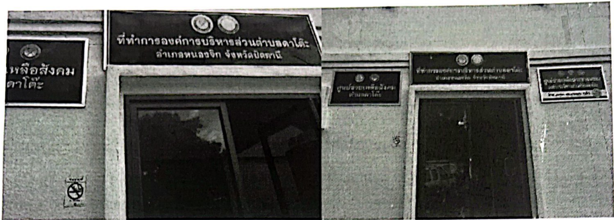
อาคารสำนักงานองค์การบริหารส่วนตำบลตาโตะ