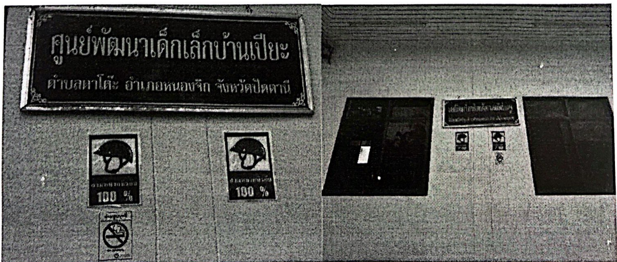
ศูนย์พัฒนาเด็กเล็กบ้านเปี้ยะ