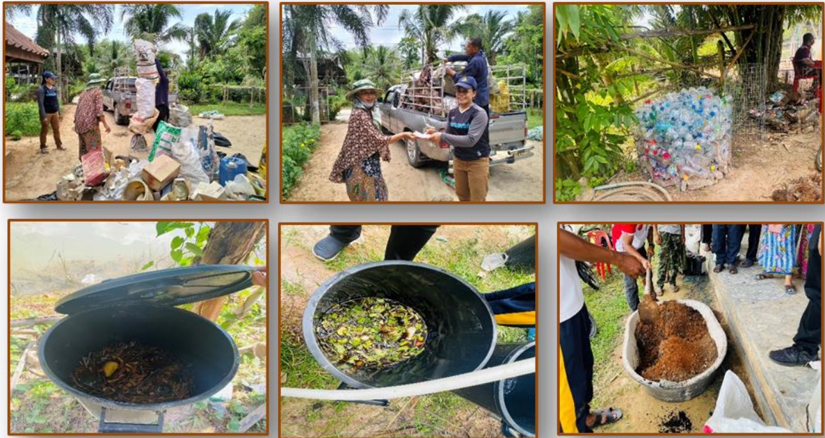
๗) นโยบายด้านอื่นๆ

๖) นโยบายด้านการพัฒนาทรัพยากรธรรมชาติและสิ่งแวดล้อม ชาวตำบลดาโต๊ะมีความร่วมมือร่วมใจกันในการลด และการคัดแยกขยะ ก่อนนำไปทิ้ง การนำกลับมาใช้ใหม่และนำไปขาย การนำเศษอาหารจากครัวเรือนมาทำน้ำหมักชีวภาพ นำมูลสัตว์ที่เลี้ยงในครัวเรือนมาทำปุ๋ยหมัก เพื่อนำไปใช้กับพืชผักสวนครัวที่ปลูกไว้ รวมไปถึงไม้ผลในสวน เป็นการลดค่าใช้จ่ายในการซื้อปุ๋ย และได้รับประทานพืชผักสวนครัวที่ปลอดสารเคมี